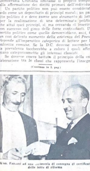
L'on. Fanfani ad una cerimonia di consegna di certificati delle terre di riforma

Il voto del Gruppo Parlamentari D. C. I Gruppi Parlamentari della D. C. hanno votato il loro favore. Al Senato, dopo ampia discussione, è stato votato all'unanimità un ordine del giorno in cui è detto che «udita la relazione del Presidente approva l'operato del Comitato Direttivo; esprime la sua piena solidarietà con la Direzione del Partito e assicura il proprio appoggio all'on. Fanfani».